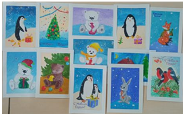
Фото 3. Творческая мастерская «Изготовление Новогодней открытки»