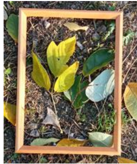
Фото 2. Экскурсия в природу