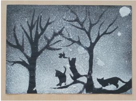
Фото 1. «Нетрадиционная техника рисования «Набрызг»