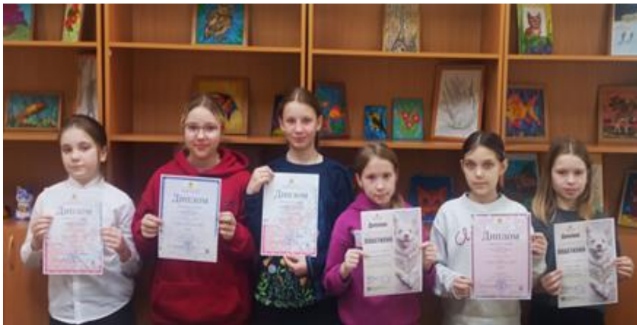
Фото 5. Победители конкурса изобразительного искусства