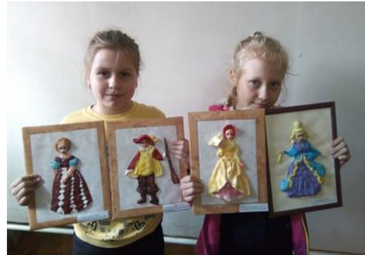
Фото 4. Творческий проект «Театральный костюм»