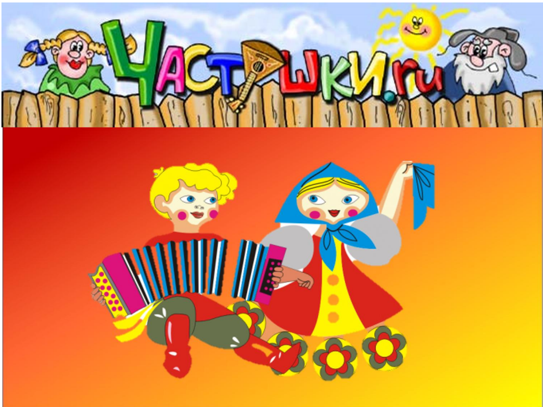
Рис. 7. Слайд 7