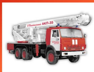
Коленчатый пожарный автоподъёмник