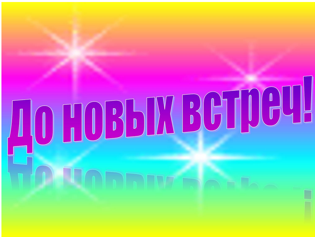
Рис. 14. Слайд 14