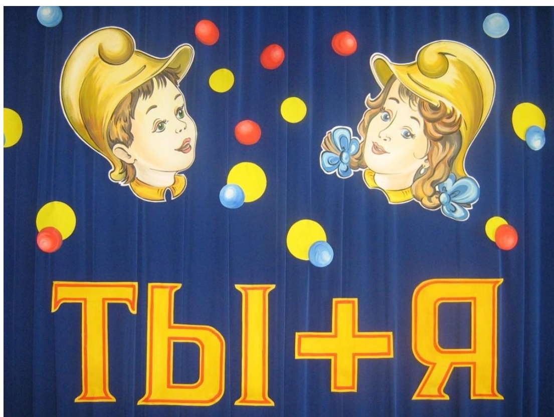
Рис. 6. Слайд 6