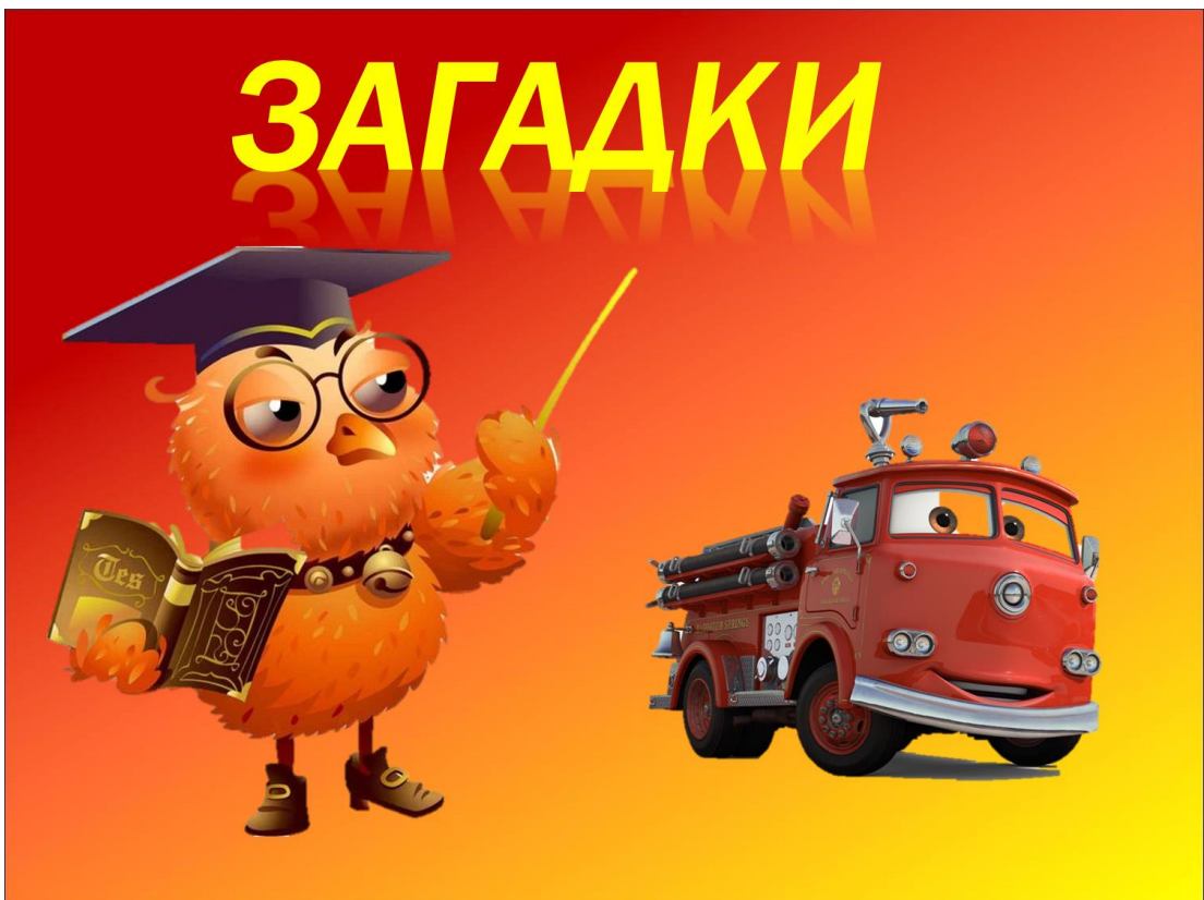
Рис. 8. Слайд 8