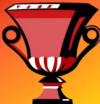
Рис. 12. Слайд 12