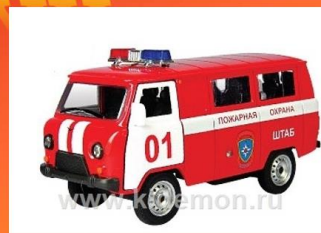
Автомобиль пожарный штабной