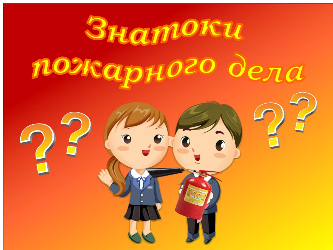
Рис. 4. Слайд 4