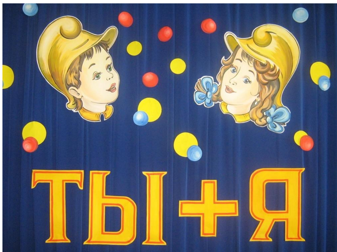
Рис. 2. Слайд 2