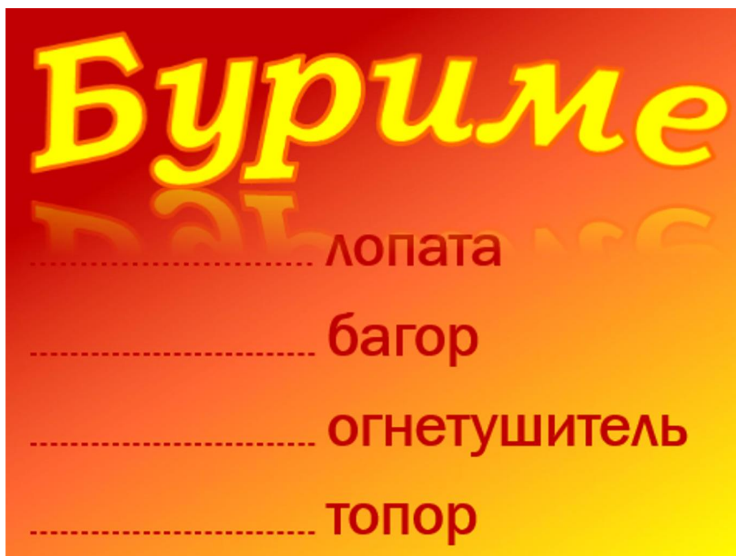
Рис. 3. Слайд 3