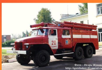
Автомобиль пожарный воздушно-пенного тушения