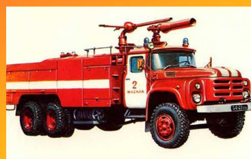
Автомобиль пожарный комбинированного тушения