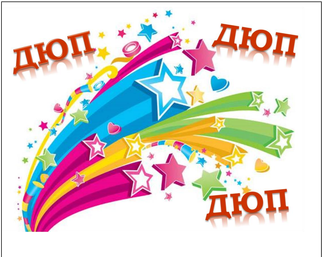
Рис. 13. Слайд 13