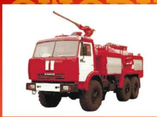
Автомобиль пожарный порошкового тушения